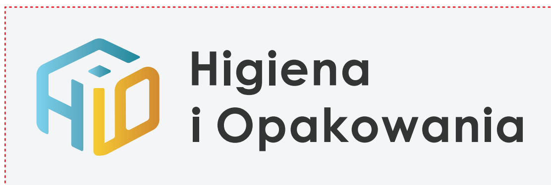
Pole ochronne znaku

Pole ochronne to obszar, na którym nie może pojawić się żadna inna forma graficzna bądź tekstowa. Jest wyznaczone na podstawie ustalonej przestrzeni pomiędzy konkretnymi elementami logo.